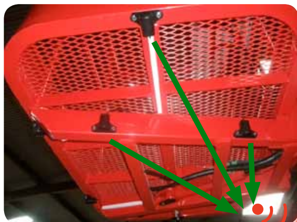
Exemple de montage sur une nacelle

Fini les malus et chocs, voir même les accidents corporels! Un confort de conduite accru pour les chauffeurs.